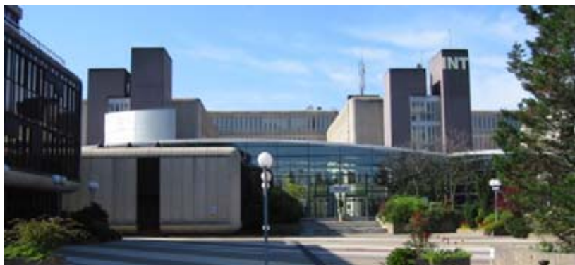
Abbildung 2: Institut National des Télécommunications, Evry, Frankreich

http://www.intmanagement.eu/p_en_post-grade_MSc_1101.html