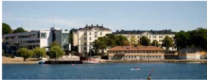
Abbildung 6: Ansicht des Hochschulorts

Durch einen Online-Masterstudiengang bietet die Hochschule besondere Möglichkeiten für Studierende, die auf Grund eines Gastaufenthalts in Deutschland oder durch einen Härtefall das 3. Semester nicht im Ausland durchführen können.