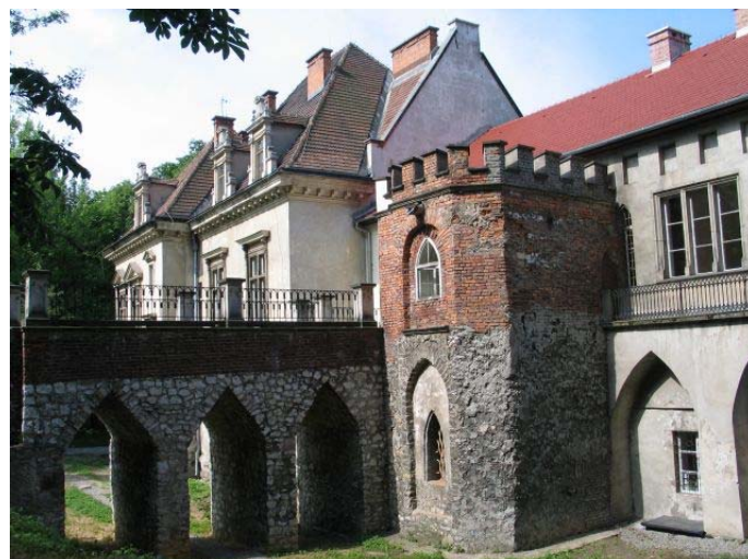
Abbildung 4: Der Moszowa-Palast und Parkkomplex

Weitere Informationen zum Studiengang sind unter http://students.interrel.pl/page-61be0174f171a4.html abrufbar.