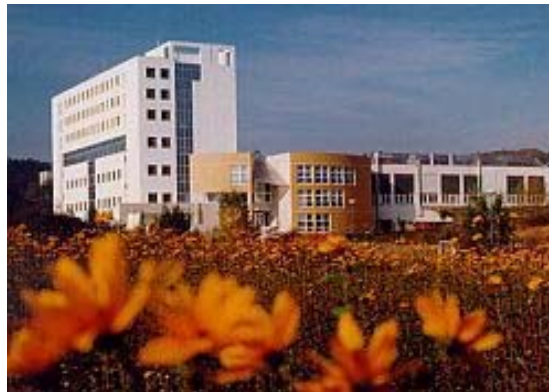
Abbildung 8: Brno University of Technology

Alle Modulbeschreibungen sind im Internet unter http://www.vutbr.cz/index.php?gm=gm_detail_oboru&oid=5581&wapp=portal&tail=37&lang=1 hinterlegt.