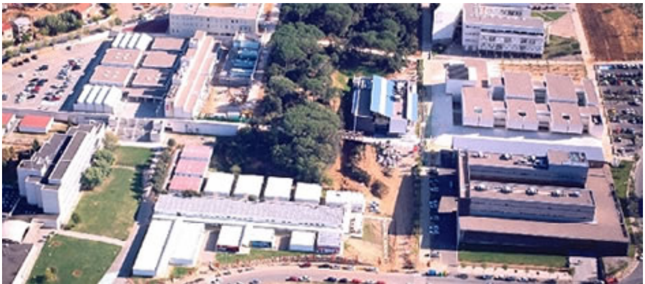
Abbildung 7: Girona International Graduate School, Spanien

Achtung: Es wird kein Master in Internationalen Management angeboten. Alle Module müssen separat mit dem Studiengangssprecher abgeglichen werden.