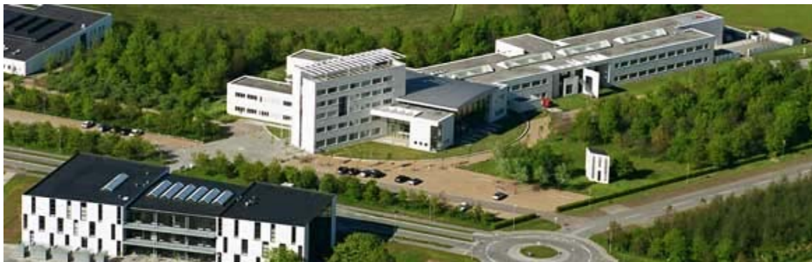
Abbildung 1: University of Aarhus, Dänemark

Achtung: Da es sich um keine Master in Internationalem Management handelt, müssen alle Module separat mit dem Studiengangssprecher abgeglichen werden.