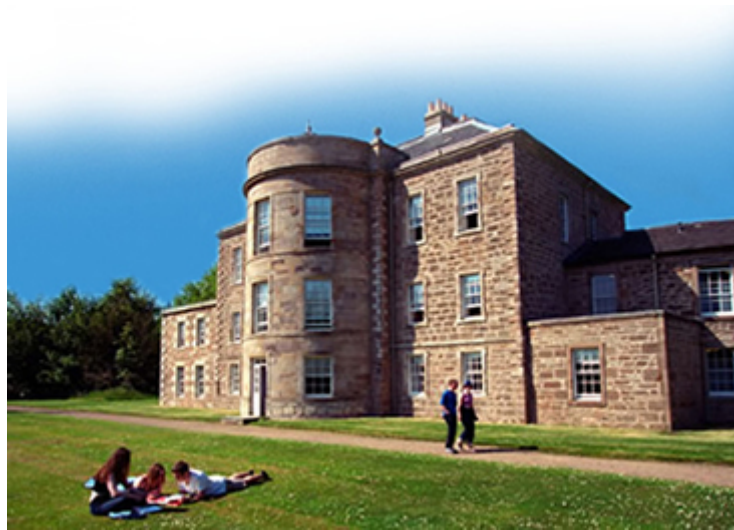
Abbildung 5: University of the West of Scotland, Business School

http://www.uws.ac.uk/schoolsdepts/business/pgmodules.asp ausführlich beschrieben.