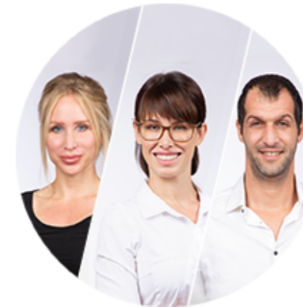
Design / Marketing / Qualitätsmanagement