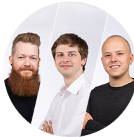
iOS & Android Development