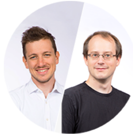
CTO / CSA