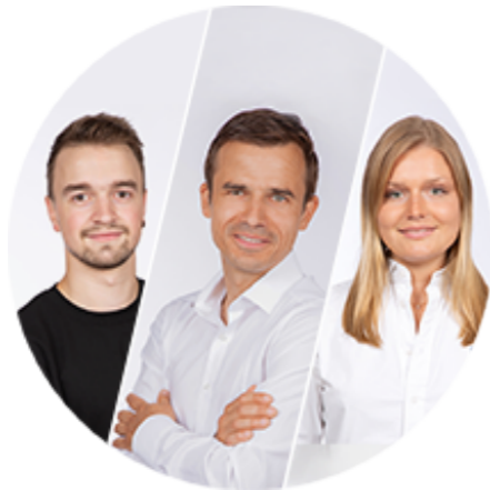
Web Development / Projektmanagement